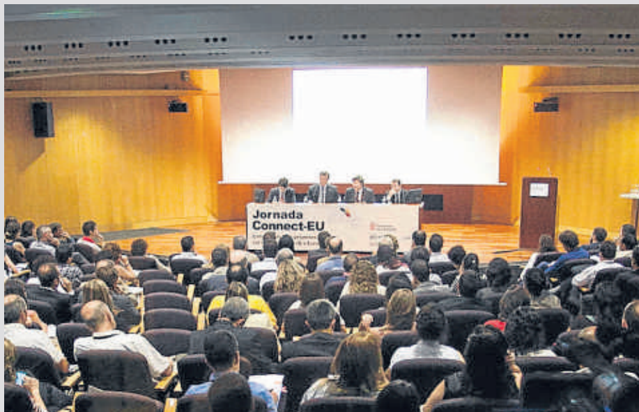
Jornada Connect-EU organizada por ACCIÓ para informar del 7º Programa Marco